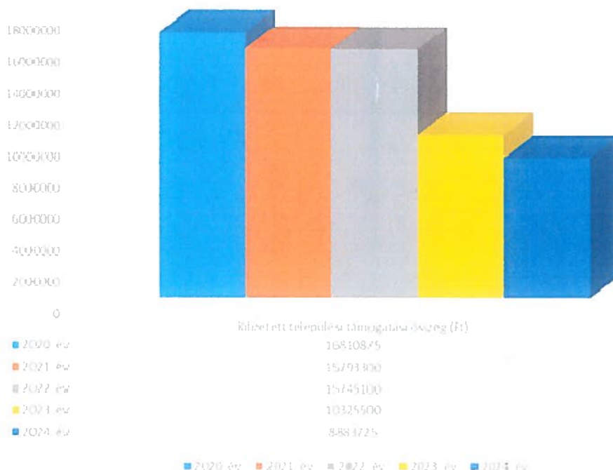
Kifizetett települési támogatási összegek alakulása 2020-2024. évben

Az alábbi diagrammok a kifizetett támogatási összegek, támogatásban részesítettek számának alakulását mutatják be: